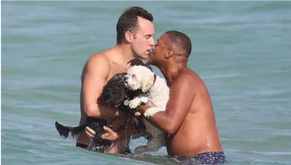
35 celebridades que são LGBTQIA+ e você provavelmente não sabia NETWORTHMAGAZINE