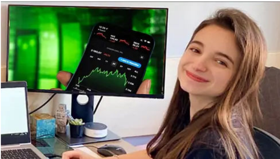
Invista €90 em ações e ganhe uma renda adicional de €2570! SMART INVESTMENT