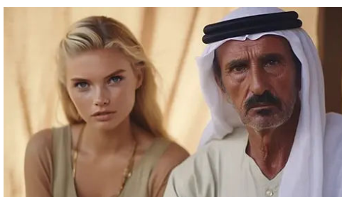
Isso é real e acontece em Dubai todos os dias CONSELHOS E TRUQUES