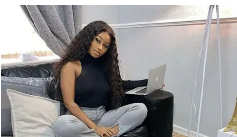
O dinheiro trabalha para você: calcule ganhos de investimento SMART INVESTMENT